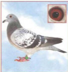
02062-04-206, W. - 2006: 12/11 Preise; RV-beste Täubin und 1. RegV-As-Täubin.