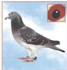
02062-04-269, V. - 2006: 11 Preise und RV-bester Vogel; 2005: 11 Preise.