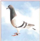
01027-02-117, W. - 2005: 12 Preise und 14. As-Täubin Allround (Verbandsbene).