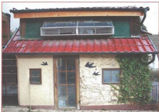
Im Untergeschoss sind die Zuchtauben untergebracht, während das Obergeschoss von den Jungtauben bevölkert wird, die vor der Herbstreise intensiv trainiert werden.